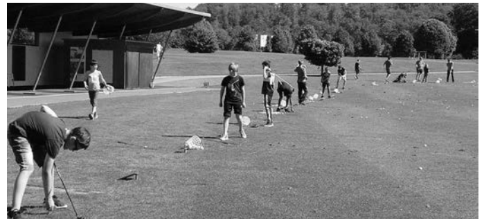
Was für ein Spaß, wenn die Bälle auf der Driving Range so richtig abzusitzen.

Jugendwart des Golf-Clubs Reutlingen/Sonnenbühl e. V. Tel. 0177-2438326, jugend@albgolf.de, www.albgolf.de